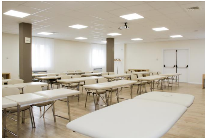
Aula del primo piano per gli eventi di Manipolazione Fasciale First floor classroom for Fascial Manipulation events