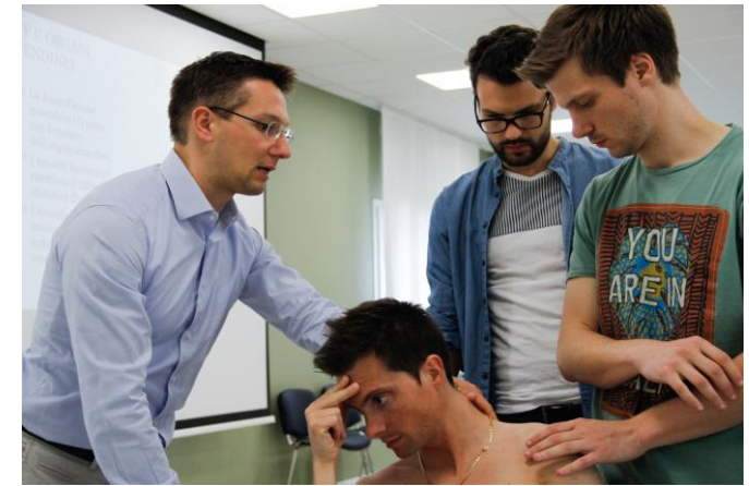
Trattamento e spiegazione di un caso clinico Treatment and explanation of a clinical case