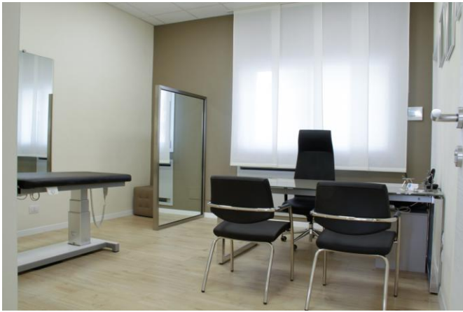
Uno degli ambulatori della sede "Manipolazione Fasciale" One of the surgeries of "Fascia Manipulation Institute"