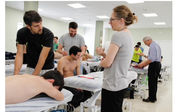
Un momento di una lezione pratica A moment of a practical lesson