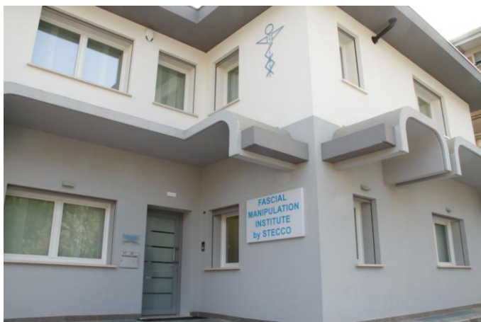
Lato sud della sede con porta di ingresso e in alto lo stemma della metodica South side of the Institute with front door and at the top the emblem of the method