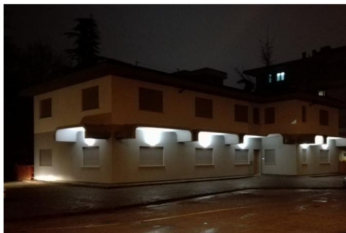
Visione notturna della sede di Fascial Manipulation Institute ripresa da ovest West night view of the Fascial Manipulation Institute

FASCIAL MANIPULATION® Institute by Stecco