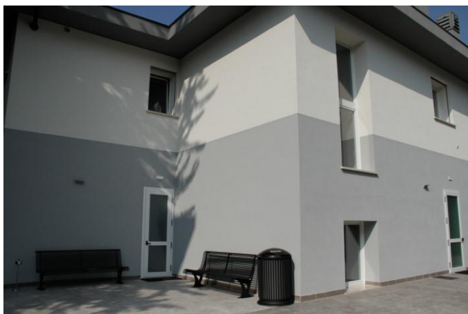
Scorcio del lato nord della sede, con un particolare del cortile interno A partial view of the north side of the building, with a detail of the inner courtyard