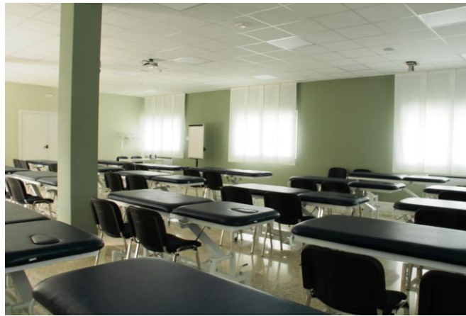
Aula del piano terra per gli eventi di Manipolazione Fasciale Ground floor classroom for Fascial Manipulation events