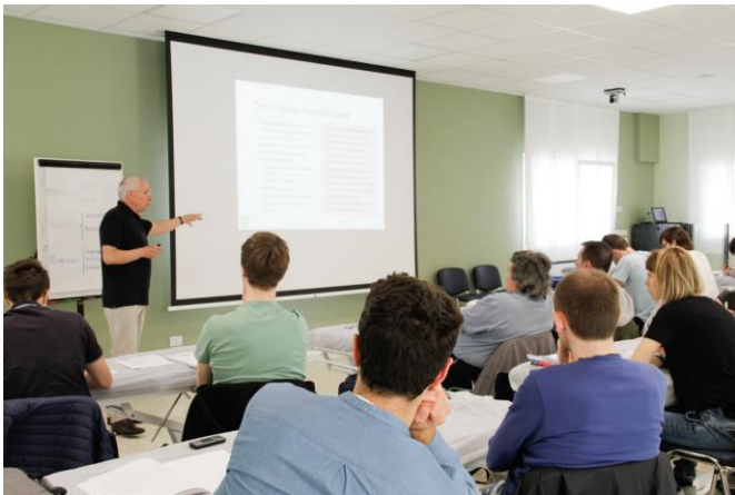
Un momento di una lezione teorica A moment of a theoretical lesson